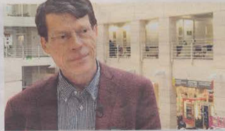
Le médecin français dirige notamment DNA Vision. -OR En vidéo: zoom sur l'intelligence artificielle dite «forte».

- Des superhéros, peut-être pas. Mais nous allons avoir dans le futur, grâce à des implants, de nouvelles capacités physiques et intellectuelles augmentées. Grâce à la génétique et aux cellules souches, nous allons augmenter notre espérance de vie dans les décennies qui viennent.